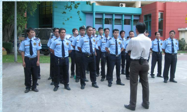
Dịch vụ cung cấp bảo vệ

- Cơ sở kinh doanh hoạt động có thời hạn theo quy định của pháp luật hoặc các văn bản quy định pháp luật được coi là bản Bản sao hợp lệ một trong các loại văn bản là giấy chứng nhận đăng ký kinh doanh; Giấy chứng nhận đăng ký doanh nghiệp; Giấy chứng nhận đăng ký đầu tư... hoặc giấy phép của các cơ quan quản lý nhà nước chuyên ngành cấp cho cơ sở kinh doanh hoạt động có thời hạn thì thời hạn sử dụng Giấy chứng nhận đủ điều kiện về an ninh, trật tự không vượt quá thời hạn ghi trong các văn bản đó;